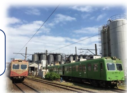
▲銚子電鉄(イメージ)

※利用特典が多数ございます。 詳細は、銚子市観光協会にご確認ください。 http://www.choshikanko.com/ TEL:0479-22-1544